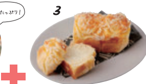
3 デューフロマーージュ 2個 ¥560