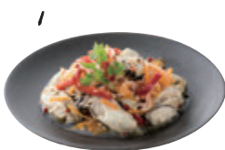
1 広島県産 牡蠣のマリネ 200g ¥1,058

パーティーしよう!と思ったらすぐに始められる。ワインなどのおつまみにもピッタリ!!