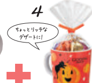
4 ハロウィン アソートメントマグカップ 1カップ (13粒入) ¥3,024