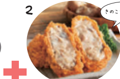
2 3種の木の子とチキンのクリームコロッケ 4個 ¥996