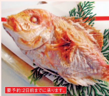
要予約:2日前までに承ります。

七五三のお祝いに。 ▲焼き鯛(1尾) ..... 2,990円 まさに海鮮の宝宝箱!食卓に美味しさの花が咲きます。 七五三のお祝いに是非どうぞ! 海鮮バラチラシ寿司 (2人前) ..... 990円